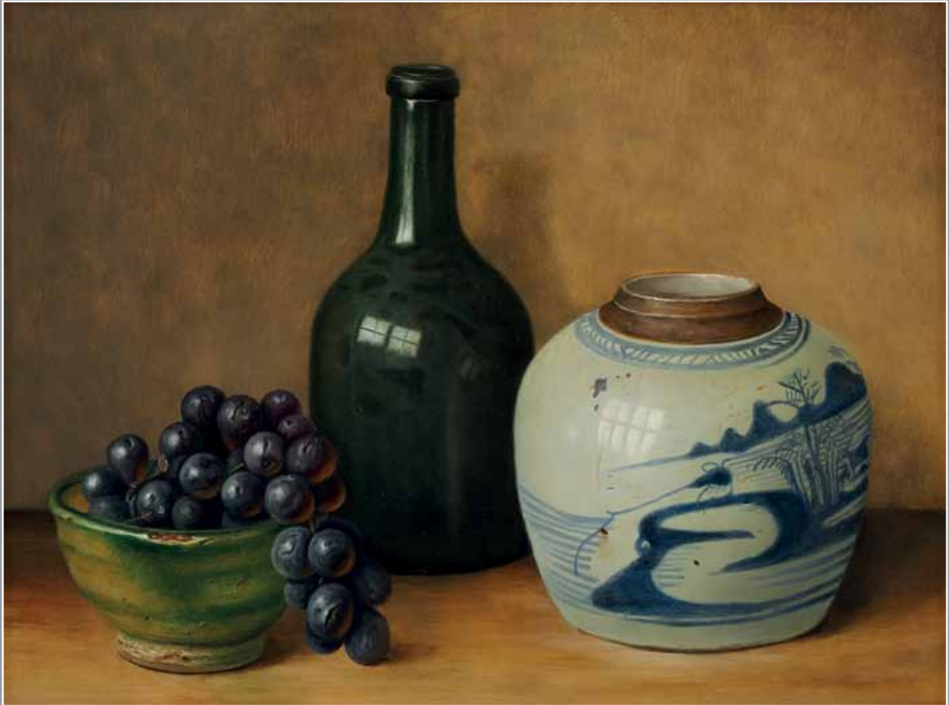
Gemberpot, fles en druiven olieverf op paneel, 30 x 40 cm, 2008