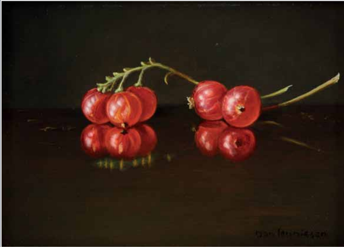
Vijf weerspiegelende rode bessen olieverf op paneel, 13 x 18 cm, 2004