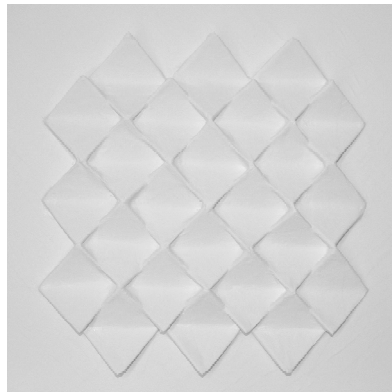
zonder titel (14 13) 30 x 30 x 5 cm papier, karton, mdf, acryl