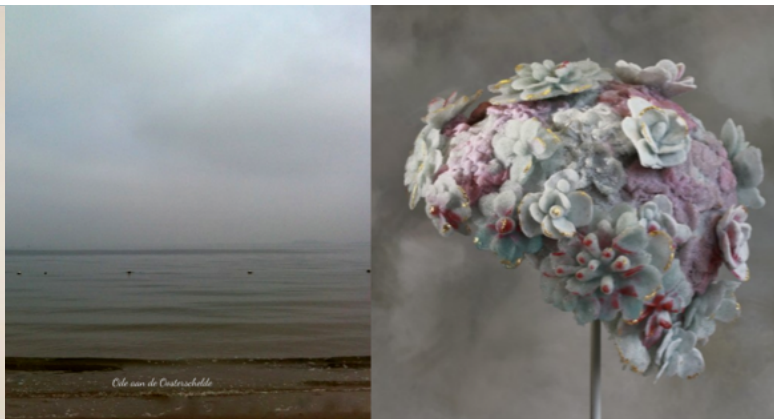
Ode aan de Oosterschelde

zwemmen voelde als een vorm van verlichting, dat gevoel heb ik geprobeerd te vertalen naar mijn kunst.” Op 17 september wordt de winnaar van de award bekendgemaakt in Praag. „De prijswinnaar mag drie weken naar New York om daar drie workshops naar keuze te volgen. Dat was voor mij de reden om mee te doen. New York is the place to be op het gebied van glaskunst. Daar kan ik me verder ontwikkelen.”