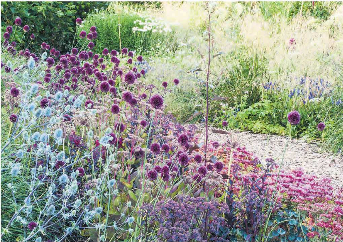
Ton ter Linden, autodidact, maakte naam met het combineren van transparante planten, siergrassen en bloembollen.